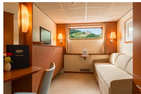
Kabine am Hauptdeck

Kabinengrundrisse zur Orientierung (nicht maßstabsgetreu)