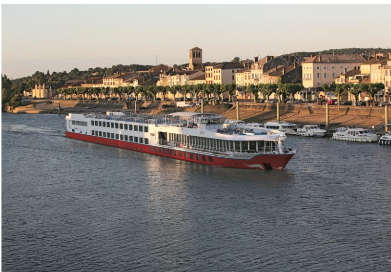
MS BIJOU DU RHÔNE